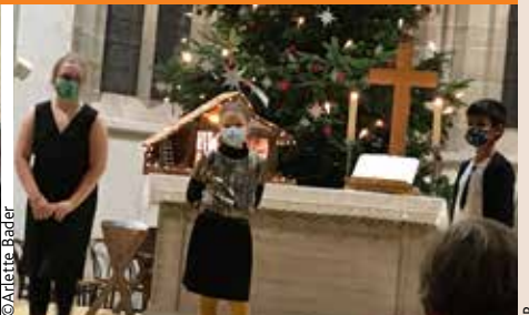
Fête de Noël des enfants le 17 décembre. Des enfants peu nombreux...mais efficaces.