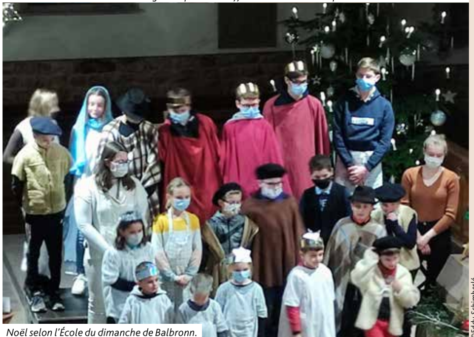
Noël selon l'École du dimanche de Balbronn.