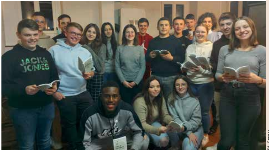
Célébration du culte par les jeunes en compagnie des étudiants de théologie protestante de Strasbourg le 12 décembre. Un beau soleil de gaieté qui a réchauffé le cœur de tous nos paroissiens.