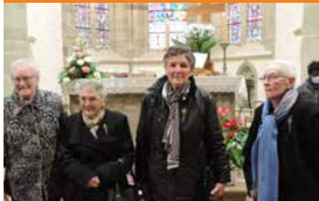
Jubilé de confirmation du 14 novembre avec les jubilaires 70-80 ans de confirmation qui n'étaient pas en photo dans le dernier Messenger !