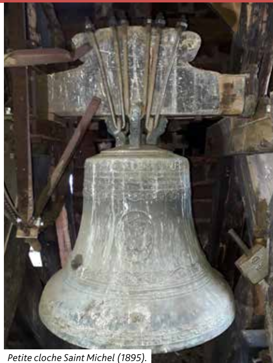
Petite cloche Saint Michel (1895).

Il est d'usage de personnifier les cloches ; on leur donne un nom, on les baptise, on les décrit en parlant de leur cerveau, de leur panse, de leur robe ou de leur lèvre inférieure. Amalric de Metz (775-850), archevêque de Trèves, écrit : « Le signal de l'Église présente de mystérieuses analogies avec l'homme apostolique dont la fonction principale