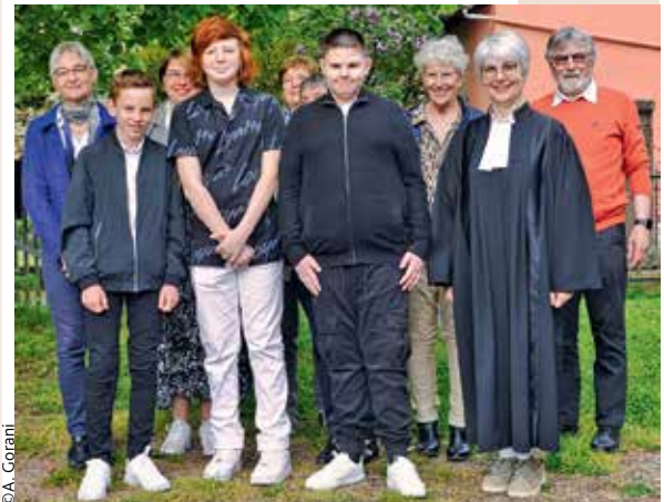
Les confirmés de Wangen Marlenheim avec la pasteur et les conseillers.

Alors qu'il y a deux ans, nous ne pensions peut-être pas que cela soit possible, il me semble que maintenant, nous ne pensons plus que cela puisse encore être autrement.