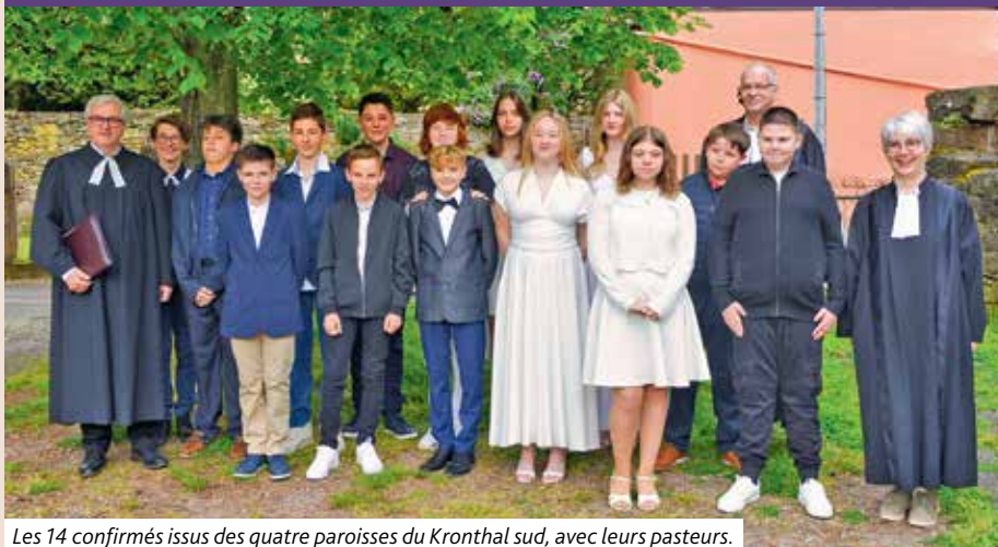
Les 14 confirmés issus des quatre paroisses du Kronthal sud, avec leurs pasteurs.