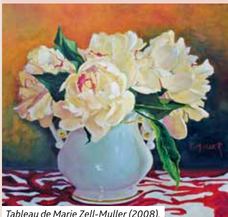
Tableau de Marie Zell-Muller (2008).

« Jésus dit : Je suis le chemin, la vérité et la vie. Nul ne vient au Père que par moi » (Jean 14,6).