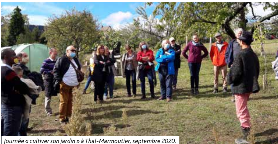
Journée « cultiver son jardin » à Thal-Marmoutier, septembre 2020.

Si les contraintes sanitaires le permettent, réunion physique à l'Espace Saint Laurent de Wasselonne. Dans le cas contraire, nous organiserons la réunion sur Internet, en visioconférence.